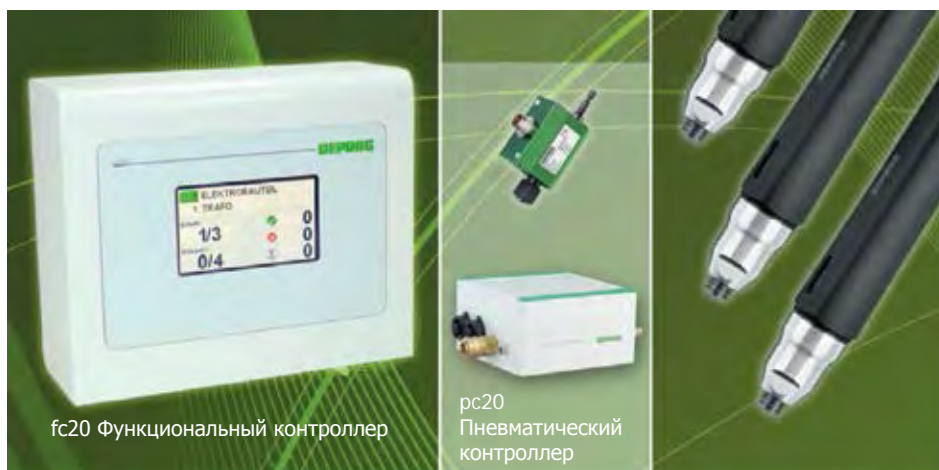
fc20 Функциональный контроллер

Шуруповерты с подключением к функциональному и пневматическому контроллеру являются комплексным решением для надежного и качественного процесса сборки.